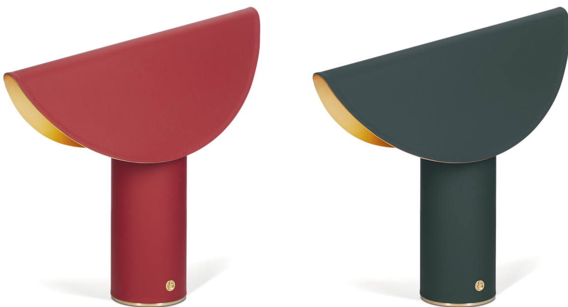
NORIKO Lampada da Tavolo